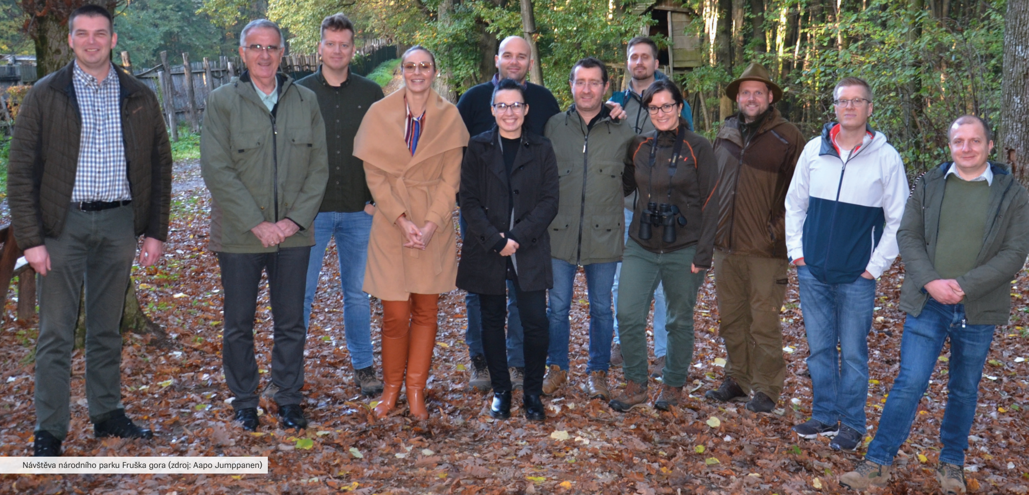
Návštěva národního parku Fruška gora