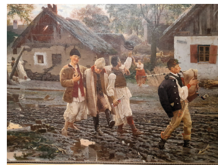
Uroš Predić: Happy Brothers (1887)

Exkurze druhého dne zavedla partnery do města Novi Sad a do Galerie Matice srbské. Finský tým se musel 11. listopadu brzy ráno vrátit zpět domů a přišel tak o terénní výlet na Lov Neuzina. Nadcházející partnerské setkání v České republice by mohlo nabídnout příležitost získat přímou zkušenost s lovem ve střední Evropě.