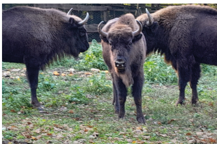
European bison

První den byl zakončen exkurzí do národního parku Fruška gora, kde proběhlo setkání s pra-